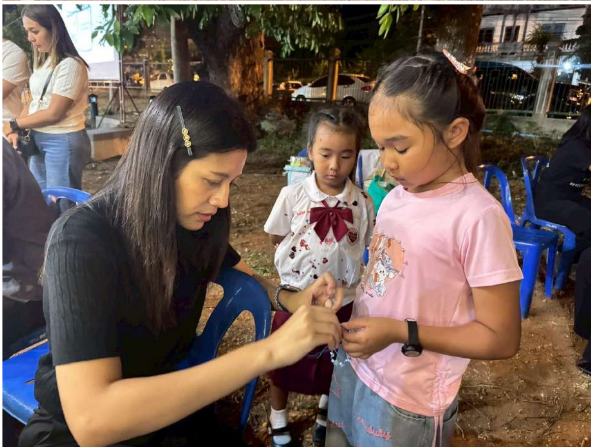
สรุปผลการดำเนินงานโครงการยกระดับคุณภาพห้องสมุดประชาชนในพื้นที่วัดกรรมนาร่อง ประจำปีงบประมาณ 2569