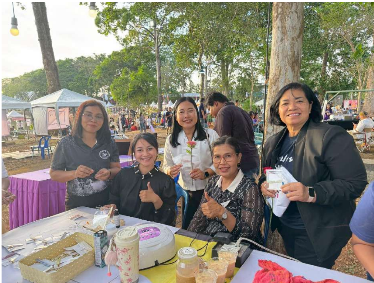
สรุปผลการดำเนินงานโครงการยกระดับคุณภาพห้องสมุดประชาชนในพื้นที่วัดกรรมนาร่อง ประจำปีงบประมาณ 2569