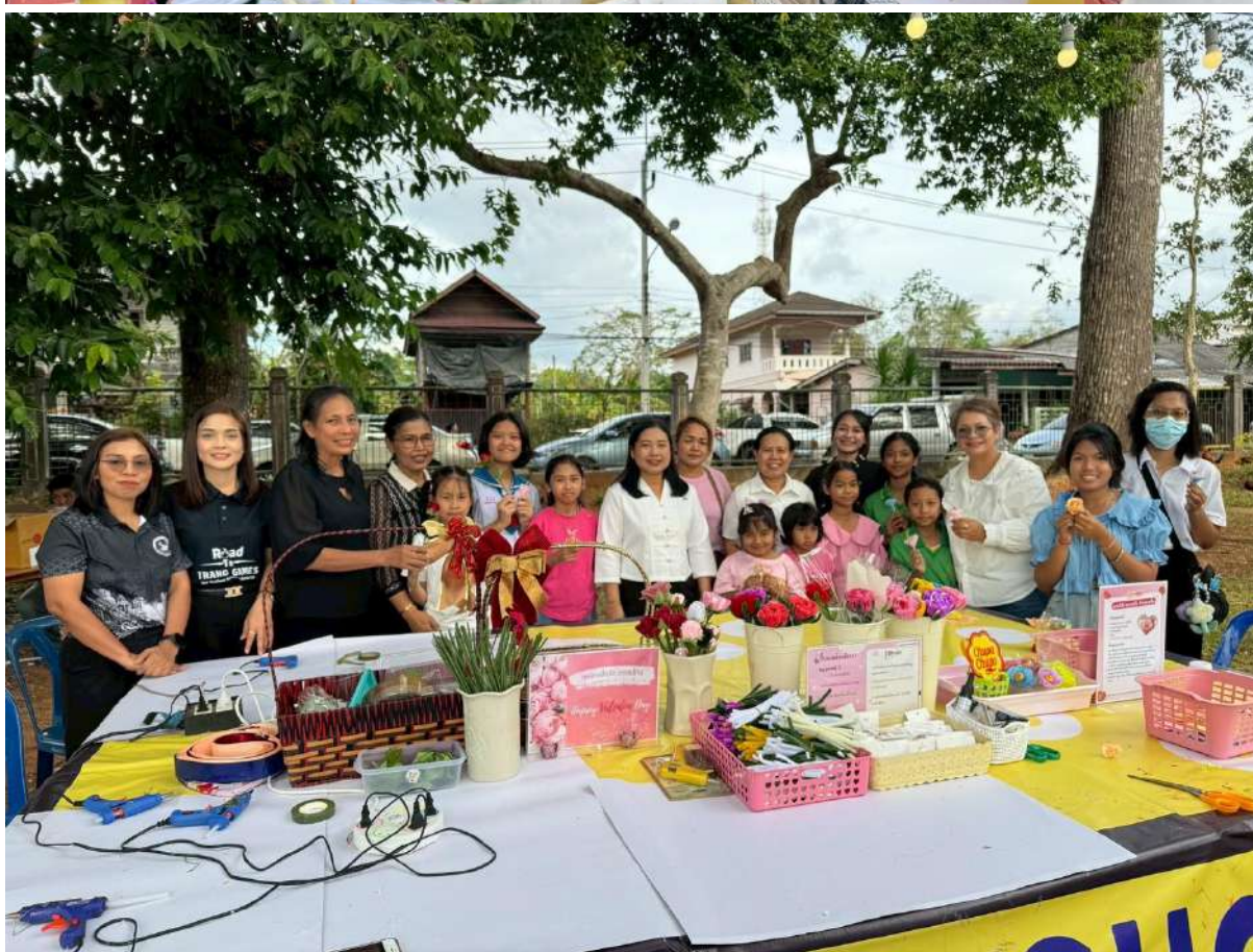
สรุปผลการดำเนินงานโครงการยกระดับคุณภาพห้องสมุดประชาชนในพื้นที่วัดกรรมนาร่อง ประจำปีงบประมาณ 2569