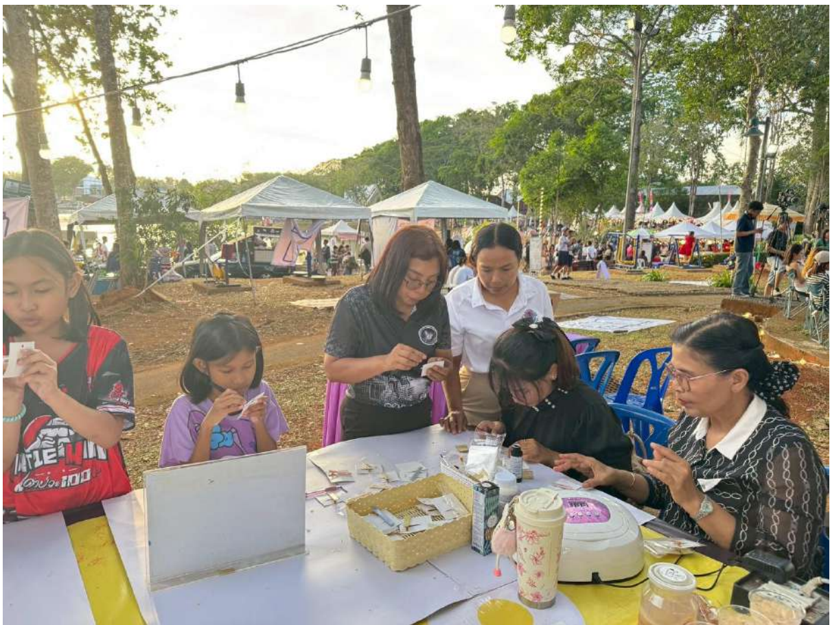
สรุปผลการดำเนินงานโครงการยกระดับคุณภาพห้องสมุดประชาชนในพื้นที่นวัตกรรมการเมือง ประจำปีงบประมาณ 2569