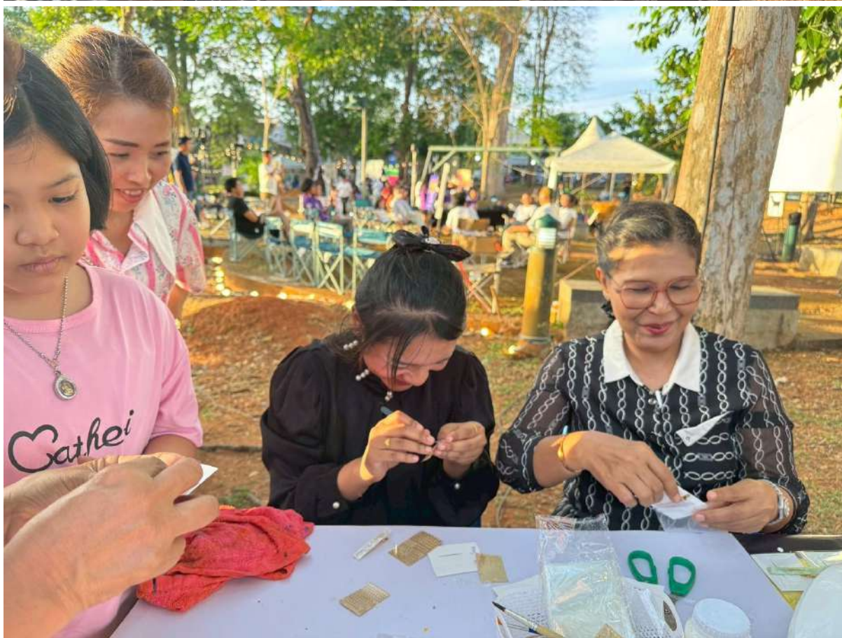
สรุปผลการดำเนินงานโครงการยกระดับคุณภาพห้องสมุดประชาชนในพื้นที่วัดกรรมนาร่อง ประจำปีงบประมาณ 2569