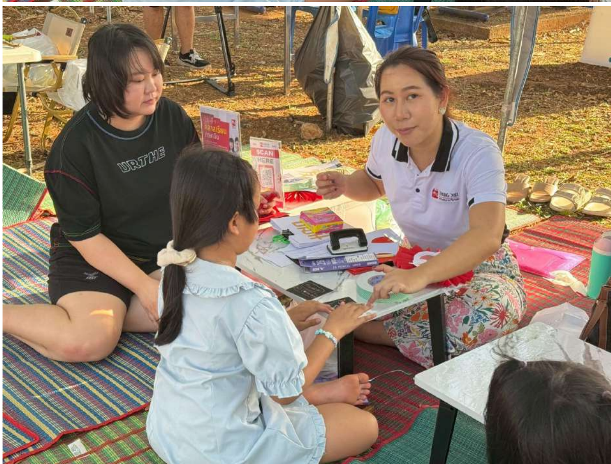
สรุปผลการดำเนินงานโครงการยกระดับคุณภาพห้องสมุดประชาชนในพื้นที่นวัตกรรมการเมือง ประจำปีงบประมาณ 2569