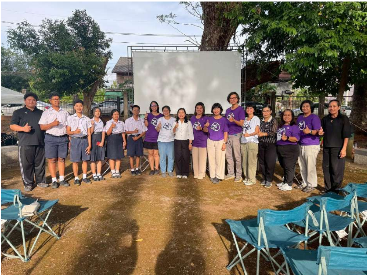
สรุปผลการดำเนินงานโครงการยกระดับคุณภาพห้องสมุดประชาชนในพื้นที่วัดกรรมนาร่อง ประจำปีงบประมาณ 2569