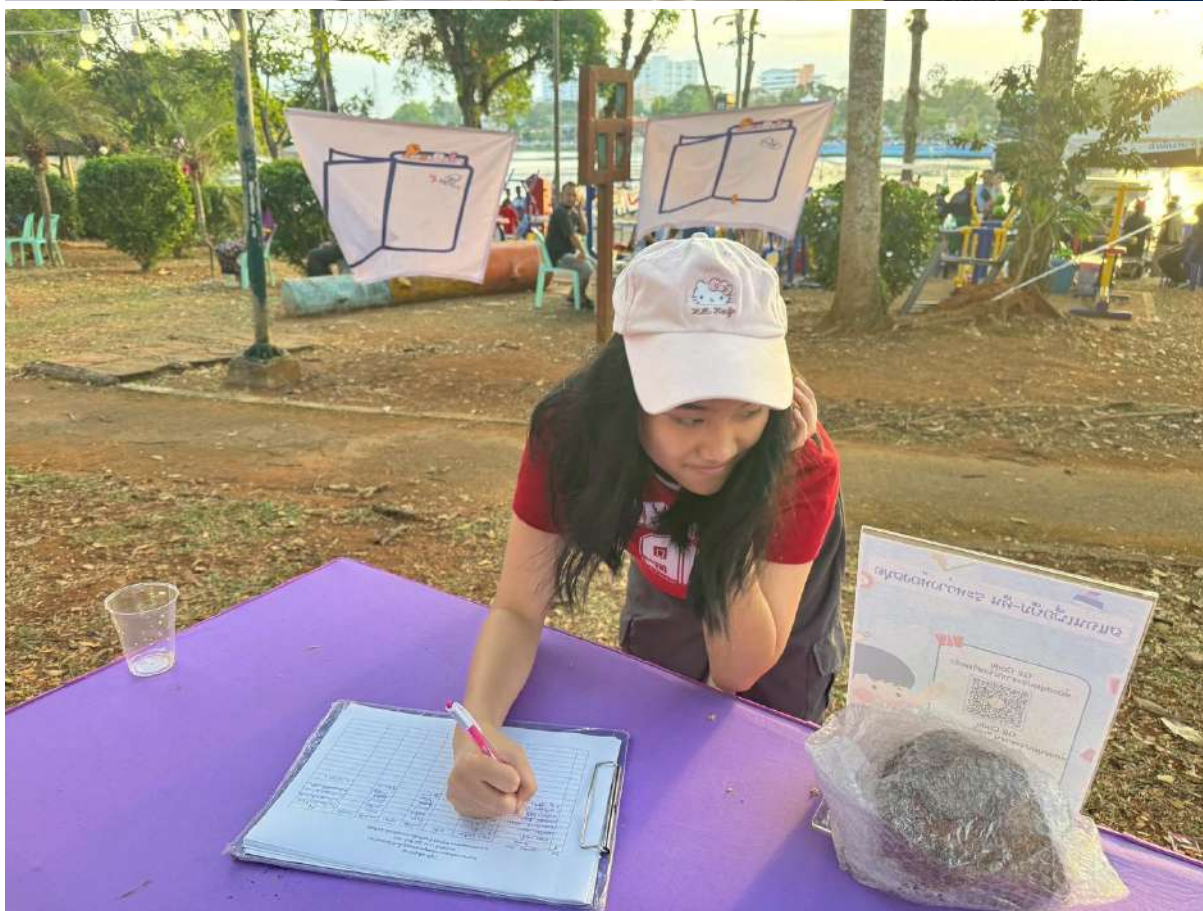
สรุปผลการดำเนินงานโครงการยกระดับคุณภาพห้องสมุดประชาชนในพื้นที่วัดกรมท่ารอง ประจำปีงบประมาณ 2569