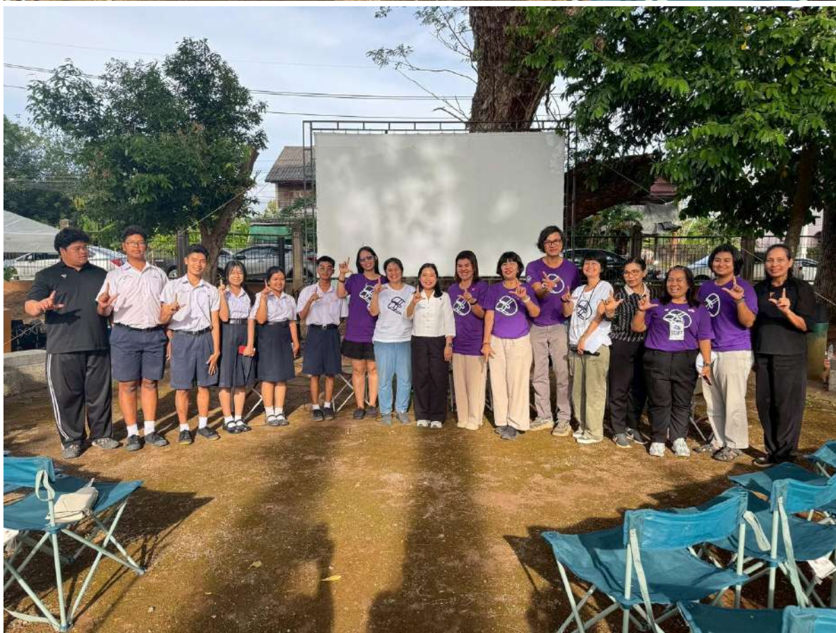
สรุปผลการดำเนินงานโครงการยกระดับคุณภาพห้องสมุดประชาชนในพื้นที่วัดกรรมนาร่อง ประจำปีงบประมาณ 2569