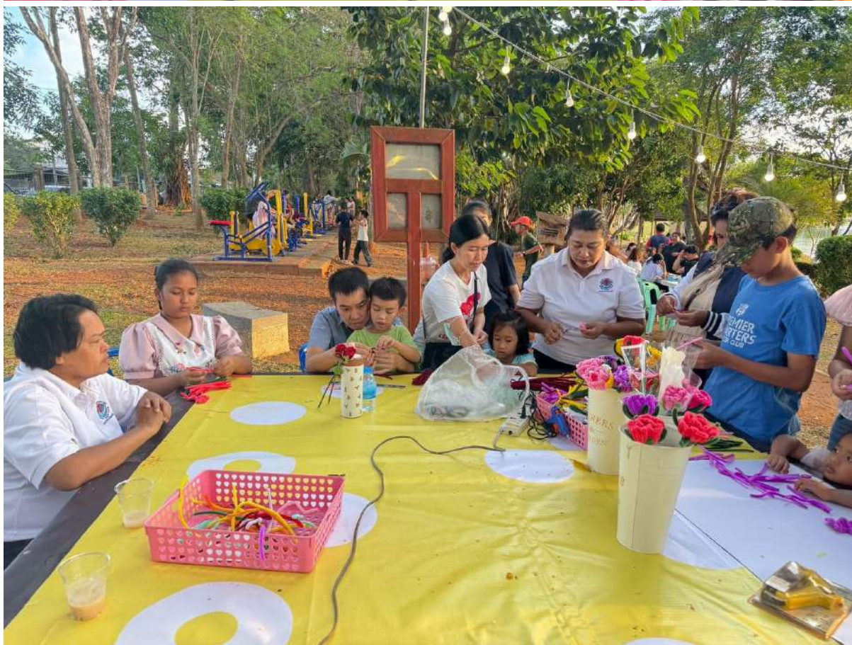
สรุปผลการดำเนินงานโครงการยกระดับคุณภาพห้องสมุดประชาชนในพื้นที่วัดกรรมนาร่อง ประจำปีงบประมาณ 2569